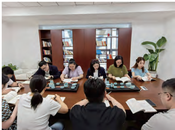
为深入推进公司廉洁文化建设，涵养清风正气，营造“爱读书、读好书、善读书”的浓厚氛围，9月11日下午，供应链公司在图书室举办了“青春扬清风·书香润廉心”主题读书会。（赵超）

坚持整改落实，优化闭环管理。灌西纪委持续强化日常监督力度，构建起以各单位、部门自查为主，公司纪委不定期抽查为辅的监督模式，以便于精准识别问题，并及时、准确地将问题反馈至相关职能部门、部门，并明确要求其在规定期限内落实整改措施。同时，建立长效跟踪机制，按照问题清单及整改提示单内容对整改闭环效果进行持续跟进，确保整改工作不打折扣、不走过场。通过这一系列闭环整改举措，精准把握基层单位的实际动态，为企业稳定发展提供坚实保障。（唐玲）