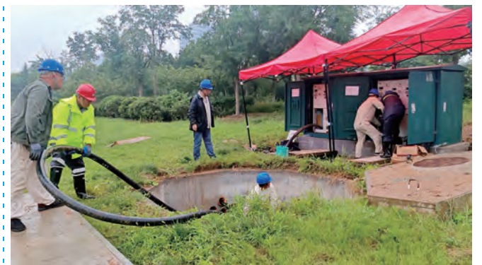
日前,供电公司台北供电所精准把握35千伏进线计划停电的关键窗口期,秉持“一盘棋”统筹思维,将停电检修与隐患治理工作同步推进,在有限时间内高效完成多项重点任务。(张伟)

筑牢防线,守护生态安全。以“党政同责、一岗双责”为核心,细化目标至班组岗位,排查整改隐患10项,整改完成率100%;推行夏季弹性工作制错峰作业,结合高温生产特点,通过“案例+模拟”强化安全知识培训,职工违规率下降15%;防汛、触电等应急演练让响应时间从5分钟缩至3分钟,规范处置率达95%。深化绿色生产,通过提升卤水利用率、减少物资浪费等举措,同步加强环保设施运维,严控污染物排放,让绿色成为生产“鲜明底色”。(程龙 许东彦)