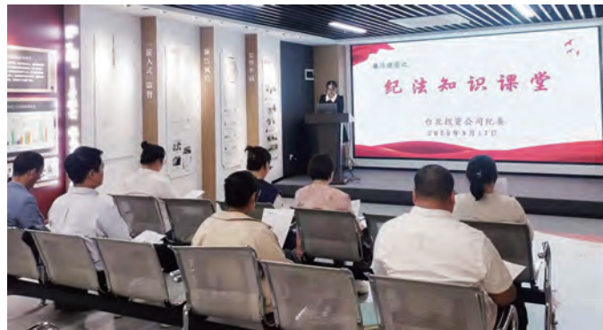
近日，台北投资公司纪委举办一期“廉洁课堂”，组织全体专兼职纪检人员对《国有企业管理人员处分条例》进行专题学习。通过学习，引导大家时刻保持警醒，自觉遵规守纪、廉洁从业，秉公用权。（陈炳辰）

强化纪律意识，吹响廉洁“冲锋号”。以发送廉洁短信，强化节前廉洁提醒工作。制定下发了神特公司“多维‘廉’动强底色”主题活动，以“四心”涵养廉底蕴、“三沐”覆盖全领域、“两常”构建新路径为载体，推动廉洁文化建设提质增效。是加大党风党纪监督员业务素质提升力度，专题学习《监察法》等法律法规，从而适应新形势发展要求。（章洁）